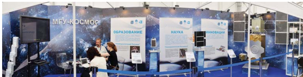
Стенд МГУ на Международном авиационно-космическом салоне МАКС-2011

На выставке были представлены результаты уникальной образовательной космической программы МГУ, главная идея которой заключается в том, что университетский микроспутник представляет собой «летающую учебную лабораторию», позволяющую студентам любого университета на практике овладеть методикой анализа экспериментальных данных, получаемых с искусственных спутников Земли и с иных космических аппаратов. Эксперт экспозиции, профессор