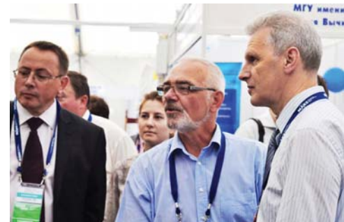
Знакомство министра образования и науки А.А. Фурсенко с экспозицией МГУ